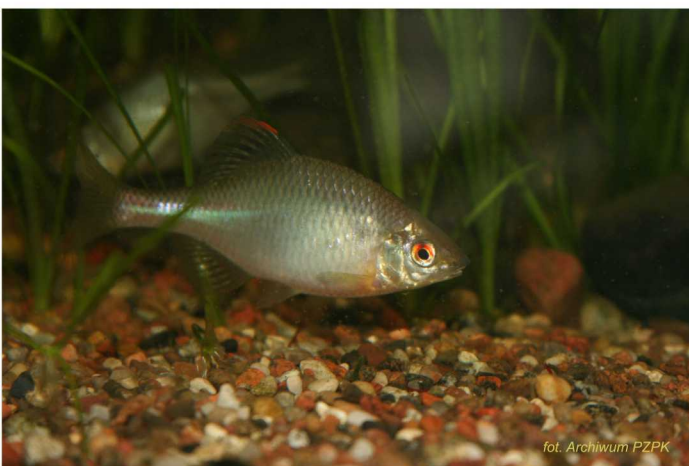
Różanka Rhodeus sericeus

Starorzecza z przyrodniczego punktu widzenia są zbiornikami cennymi, co znalazło odzwierciedlenie we wpisaniu ich do Załącznika I Dyrektywy Siedliskowej jako chronionego siedliska przyrodniczego. Często grupują rzadkie i chronione elementy flory i fauny - spotykamy w nich tak rzadkie rośliny jak: salwinię pływającą, grzybieńczyka wodnego czy grzybienię północne. Znacznie częściej występują grążele żółte, grzybienię białe i osoka aloesowata. Z rzadkich i cennych gatunków ichtiofauny starorzecza są często zasiedlane przez piskorza, kozę, różankę. Są też ważnymi godowiskami płazów i miejscami rozrodu ptactwa wodnego.