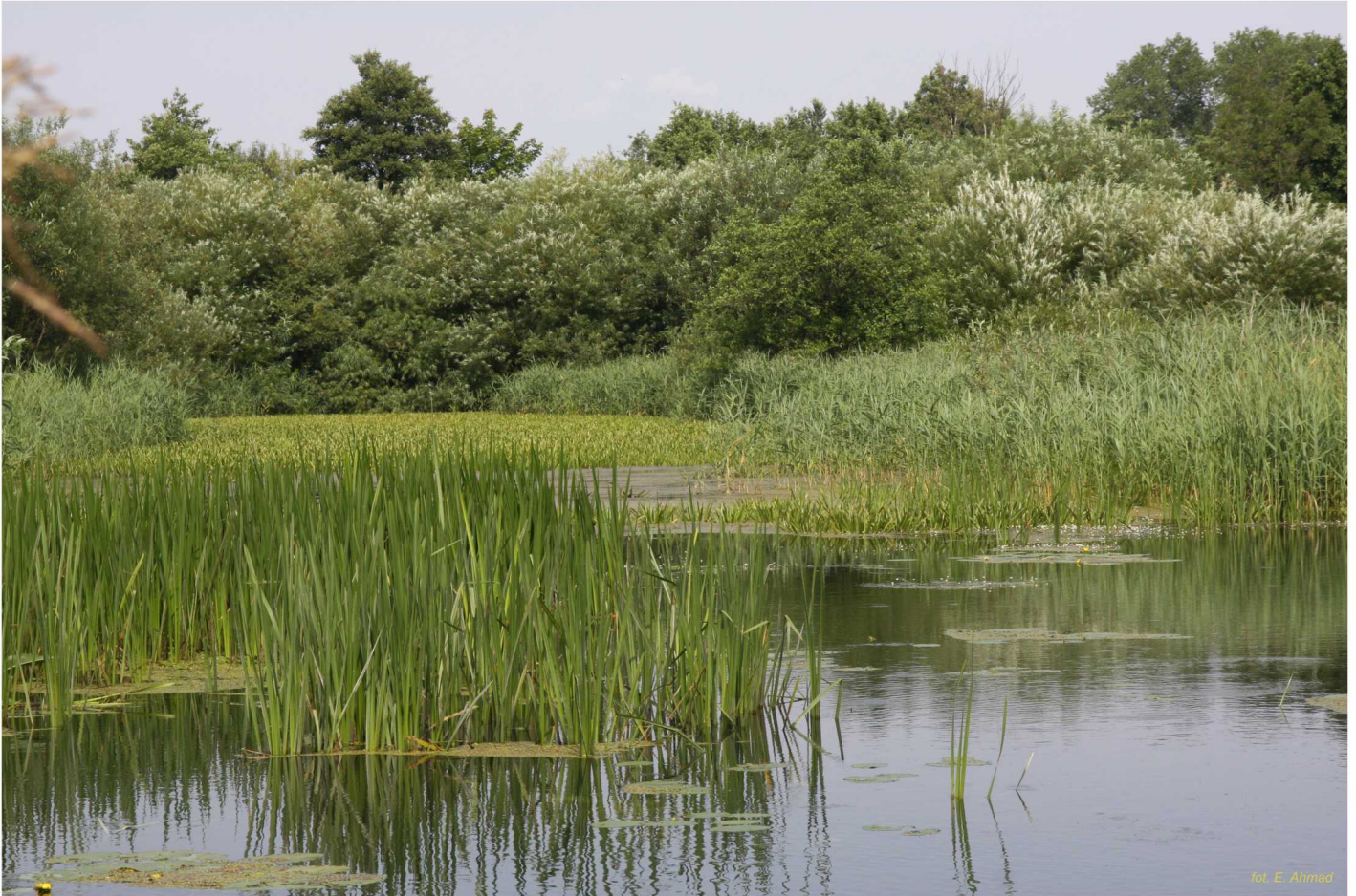
Zarastające roślinnością wodną starorzecze Słupi

Starorzecza to zbiorniki położone w dolinie rzecznej, powstałe na skutek odcięcia meandrów rzeki od głównego koryta - stanowią pozostałość po jej dawnym biegu. Najczęściej powstają w środkowych i dolnych odcinkach rzek, w sposób naturalny, jak i w wyniku regulacji prowadzonych przez człowieka. W chwili kiedy tracą one łączność z rzeką przekształcają się w jeziora rzeczne. Charakteryzują się przeważnie niewielkimi powierzchniami i głębokościami nie przekraczającymi 3 metrów oraz dużą żyznością. Cechy te powodują, że są stosunkowo nietrwałym elementem krajobrazu - ulegają szybkim procesom zarastania i zamulania, zasypywania osadami z wezbrań rzeki, co prowadzi do ich zaniku.