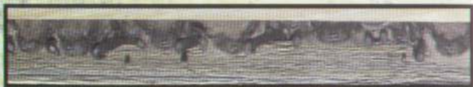
Kolonia mroczków późnych pod deską