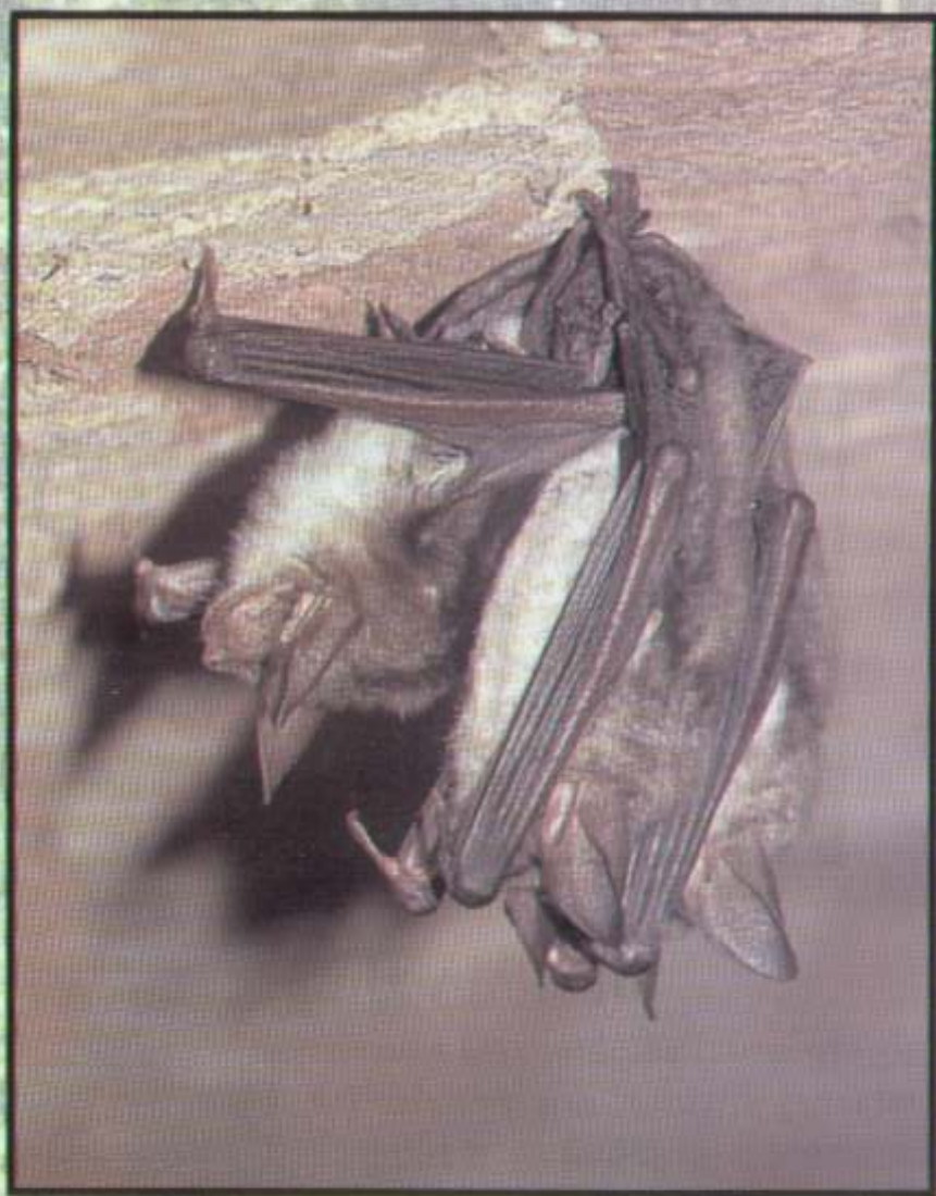
Hibemujące nocki duże

W naszej strefie klimatycznej w okresie jesiennie - zimowych chłódów z powodu braku pożywienia ( owadów ) nietoperze zmuszone są zapadać w zimowy sen zwany hibernacją. Aby optymalnie wykorzystać rezerwy tłuszczowe wybierają kryjówki chłodne, ale dobrze izolowane od wahań temperatury otoczenia np. jaskinie, piwnice, sztolnie, forty, studnie. Wysoka wilgotność w tych pomieszczeniach sprzyja pomyślnemu zimowaniu. W trakcie ponad czteromiesięcznej hibernacji nietoperze wybudzają się w celu załatwienia potrzeb fizjologicznych lub zmiany miejsca zimowania.