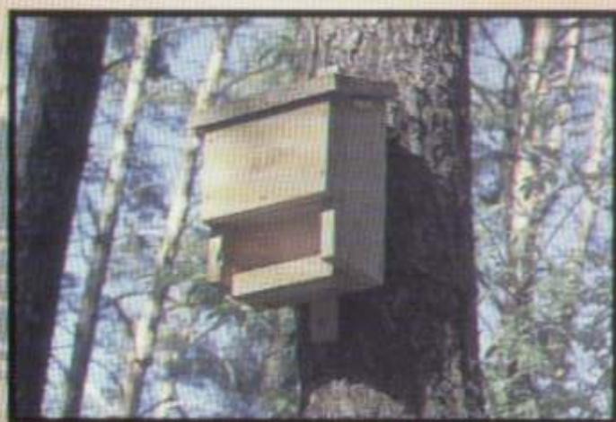
Skrzynka dla nietoperzy

Jeśli na swoim strychu lub w innym miejscu zabudowań odkryjesz kolonię nietoperzy nie niepokój ich! Rozłożenie arkusza folii PCV ułatwi sprzątanie gromadzących się odchodów, które można wykorzystać w ogrodzie jako cenny nawóz. Jeżeli planujesz remont dachu wykonaj go w okresie od sierpnia do początku kwietnia. Gdy do naszego mieszkania przypadkowo wleci nietoperz zamknijmy drzwi do innych pomieszczeń, otwórzmy szeroko okno i pozwólmy mu odlecieć. Jeśli nie odlatuje, nakryjmy go np. słótkiem i wsuńmy od spodu sztywną kartkę. Nietoperza można również chwycić przez rękawiczkę lub skórzaną rękawicę i po zachodzie słońca, jak najszybciej wypuścić. Jesteś prawdziwym przyjacielem nietoperzy? Na drzewach w ogrodzie możesz powiesić specjalne skrzynki - ich letnie schronienia.