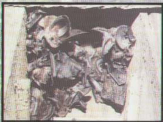
Kolonja rozrodcza gacków brunatnych

Nietoperze wybudzają się ze snu zimowego i zaczynają intensywnie żerować. Samice szukają odpowiednich kryjówek, w których tworzą skupiska zwane koloniami rozrodczymi. Naturalnymi miejscami rozrodu są dziuple starych drzew, ich brak zmusza nietoperze do szukania innych schronień np. ptasich budek lęgowych, strychów, szczelin w drewnianych budynkach. Wielkość tych zgrupowań zależy od gatunku sięga od kilku do kilkuset samic. Młode rodzą się najczęściej w czerwcu i po 20 - 25 dniach potrafią fruwać i samodzielnie zdobywać pożywienie.