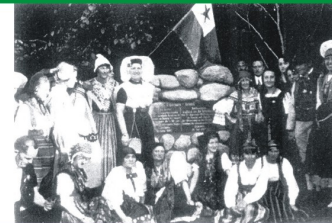
Uczestnicy Kongresu 1927 r. wokół dębu i kamienia pamiątkowego.