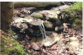
ul. Smolna już w lesie