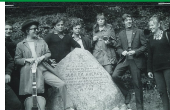
1971 r. - tradycyjna wizyta esperantystów.