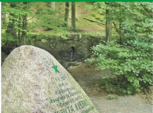
W tle potok Torento.