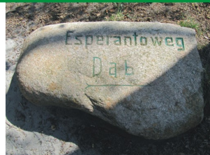
Drogowskaz na ul.Reja z 1927 r.