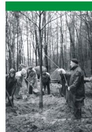
Sadzenie dębu w 1959 r.

En novembro 2013, laŭ la propono de la sopotaj esperantistoj, la Konsilantaro de la Urbo Sopot aprenis la decidon doni la nomon TARENTO al la sennoma ĝis nun rojo trafluanta najbare de la E-kverko, kiun nomon kiel la geografian konfirmis la Ministerio pri Administrado kaj Cifrizado.